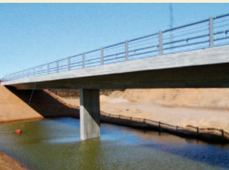
Broer er særligt udsatte for tøsalte og fysisk belastning