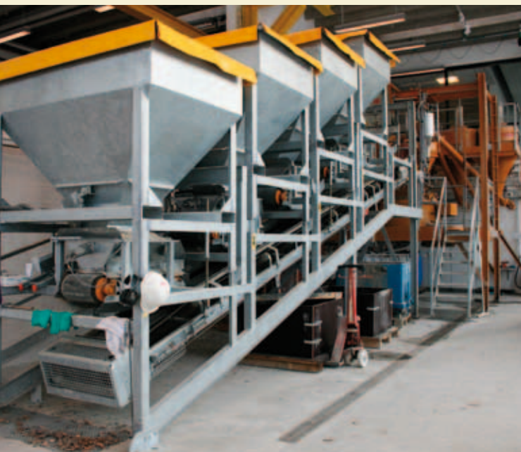
Det nye center vil udnytte komplementære kompetencer samt laboratoriefaciliteter som blandedanlægget på Teknologisk Institut