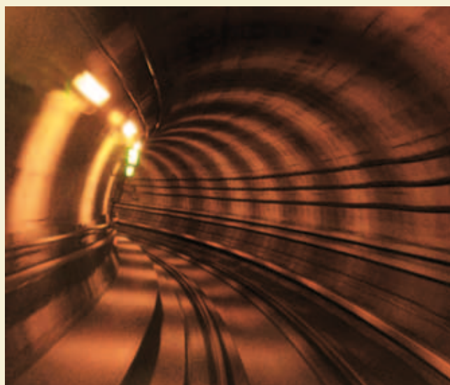
Metroen i København

Andre samarbejdspartnere vil være udenlandske universiteter som EPFL i Schweiz, Delft University i Holland, Imperial College i England, NTNU i Norge og Stanford University i USA.